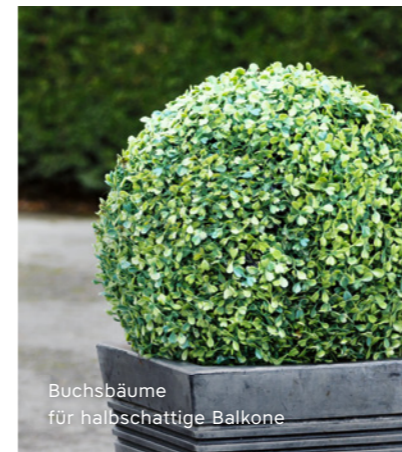
Buchsbäume für halbschattige Balkone