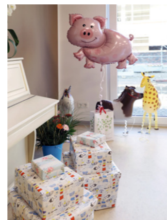
barrierefreien und teilweise rollstuhlgerechten Wohnungen. Diese

Es feiert ein Wirbelwind durch den Duisburger Norden! Doch keine Angst, hier folgt keine Schlechtwetter-Warnung: Im Januar feierte die von der Lebenshilfe betriebene Kita „Wirbelwind“ in der Werthstraße offiziell Eröffnung.