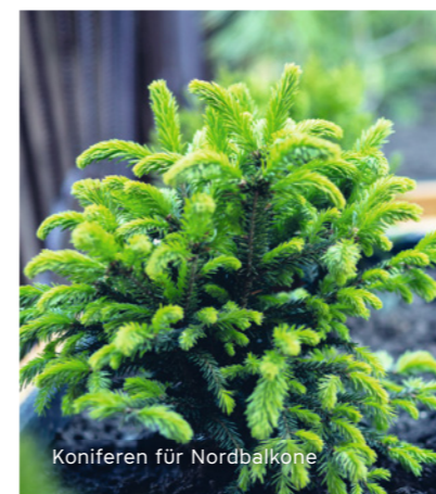
Koniferen für Nordbalkone