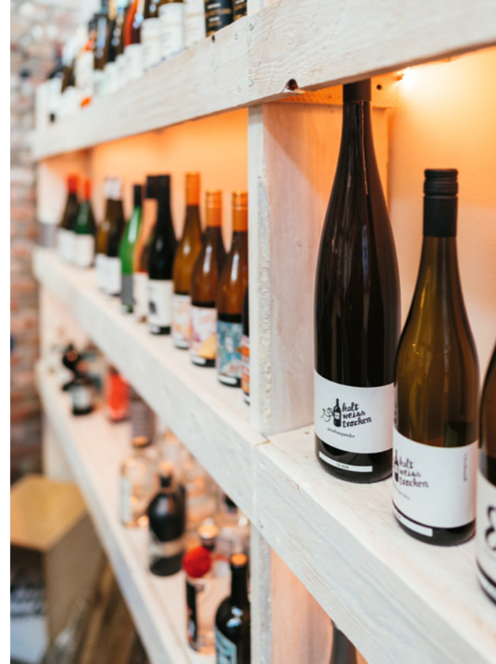
TEXT UND BILD SEBASTIAN BECKER

Im deutschen Wein hat ein Wechsel der Generationen stattgefunden. Plötzlich gibt es junge Winzerinnen und Winzer, die Wein neu denken und neu erfinden, die mutig sind, die eine Geschichte erzählen. Und eine dieser Geschichten spielt in Duisburg. Genauer gesagt in Neudorf. Hier hat kalt.weiss.trocken. sein Quartier bezogen. Der Weinhandel findet sich in einem Hinterhof, wie man ihn genauso in Berlin erwarten könnte: Hier weht ein Hauch Kreativität durch die Luft! Unter Einsatz von viel Arbeit und Liebe wurde hier in einer alten Werkstatt ein faszinierender Ort geschaffen: der wohl schönste Weinhandel im gesamten Ruhrgebiet!