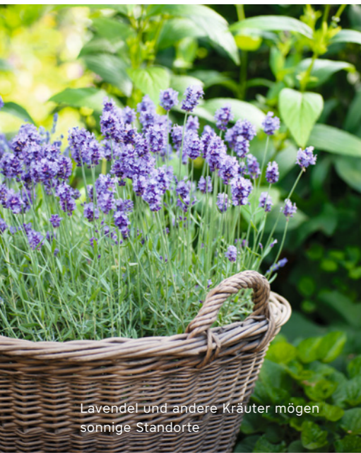
Lavendel und andere Kräuter mögen sonnige Standorte